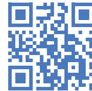
QR Code zur App

Die KEB App wird kontinuierlich weiterentwickelt und verzeichnet inzwischen rund 400 registrierte Nutzerinnen und Nutzer – ein deutliches Zeichen für ihre zunehmende Akzeptanz. Auch wenn weiteres Potenzial besteht, bietet sie bereits heute eine Plattform, die die Bundesarbeitsgemeinschaft stärkt und den Austausch spürbar erleichtert. Ziel bleibt es, noch mehr Kolleginnen und Kollegen – insbesondere auf Einrichtungsebene – für die Nutzung zu gewinnen. Im Rahmen der Berufseinführung wird sie als Kanal zu Kolleg:innen aus ganz Deutschland und zur Bundesebene vorgestellt. Als wichtiger Kommunikationskanal nimmt die App schon jetzt eine zentrale Funktion ein: Aktuelle Informationen zu relevanten Themen, etwa zu rechtlichen oder politischen Entwicklungen können schnell und unkompliziert mit allen Interessierten geteilt werden. Gute Beispiele dafür sind die sehr erfolgreichen Nachfragen und Reaktionen der letzten Wochen zu inklusiver Arbeit und zur finanziellen Bildung.