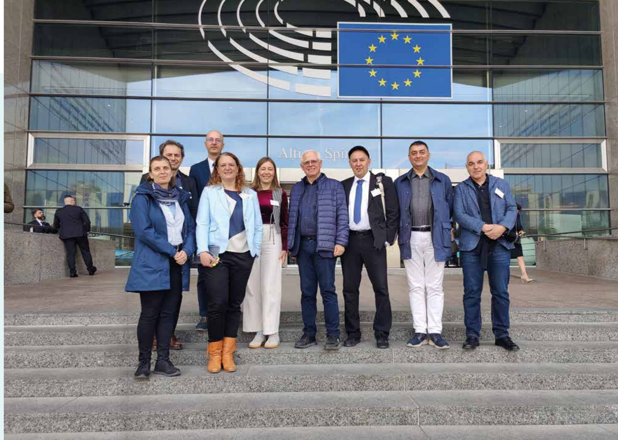
Teilnehmer:innen der FEECA Mitgliederversammlung 2026 in Brüssel

Die Geschäftsführung des Rat der Weiterbildung hat die KEB Deutschland 2025 abgegeben, wirkt aber als Mitglied weiterhin aktiv mit. Die aktuellen politischen Themen sind unter anderem wie die Kürzung der Integrationskurse und Freiberuflichkeit, zu denen sich die Mitglieder des Rates austauschen und vernetzen. Ein parlamentarisches Frühstück und auch weitere politische Aktionen sind geplant, damit die „4. Säule“ mit ihrer 40-jährigen Geschichte weiterhin im Bewusstsein bleibt.